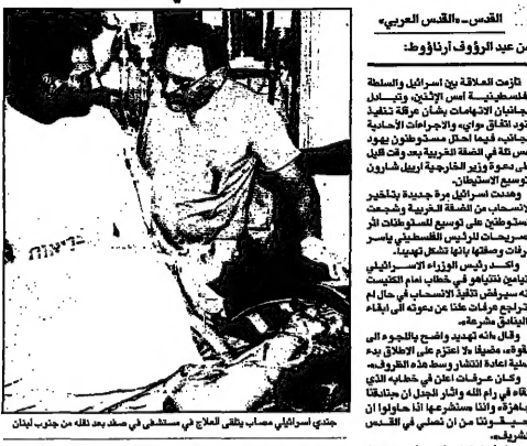
جندي اسرائيلي مصاب بجراح في مستشفى في صيدا بعد نقله من جنوب لبنان

من عبد الرؤوف أراؤوف القديس - القدس العربي تلازم العلاقة بين اسرائيل والسفيرة الفلسطينية اسس الاثنان وتبادل